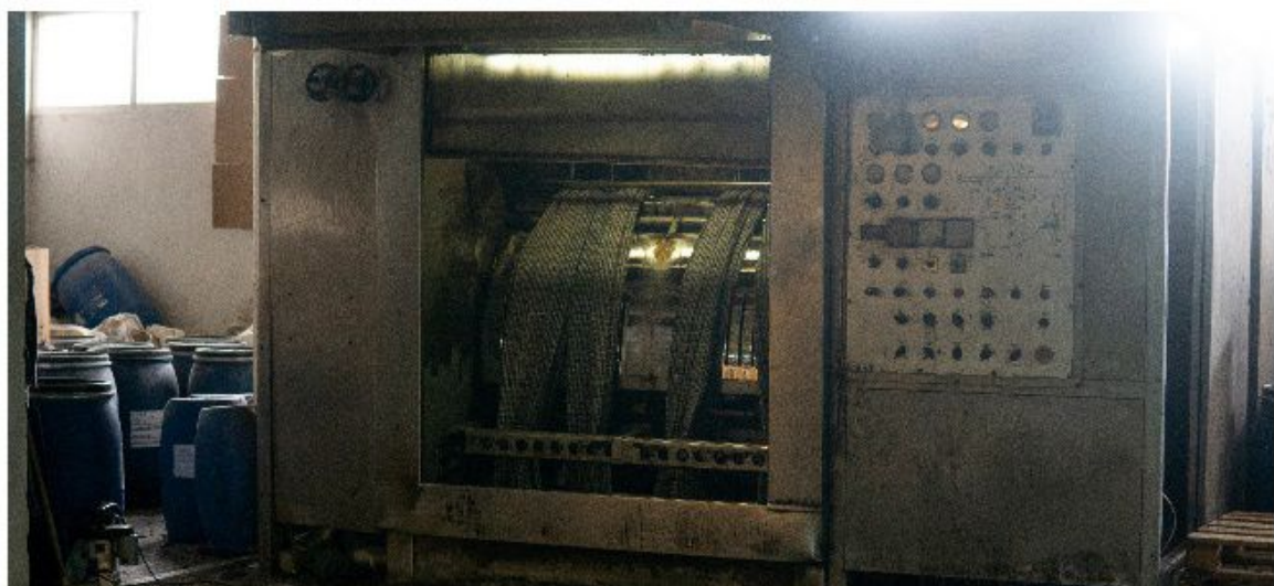
ГОРЯЧЕЙ И ПОРОВОЙ СТИРКА